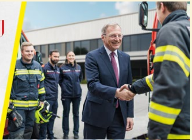
Ihr Thomas Stelzer

Handschlag und Herzschlag, das ist, wie wir unser Land gestalten. Handschlag und Herzschlag, das ist, was uns in Oberösterreich ausmacht.